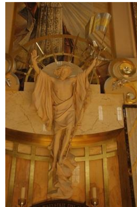
Basilika Lichen, Polen

07.30 Uhr Frühstück 08.30 Uhr Heilige Messe Reisegebet anschließend Abschied und Abreise