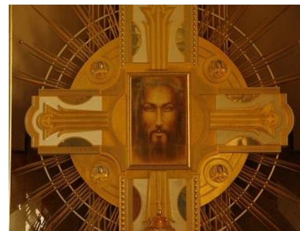
Basilika Lichen, Polen